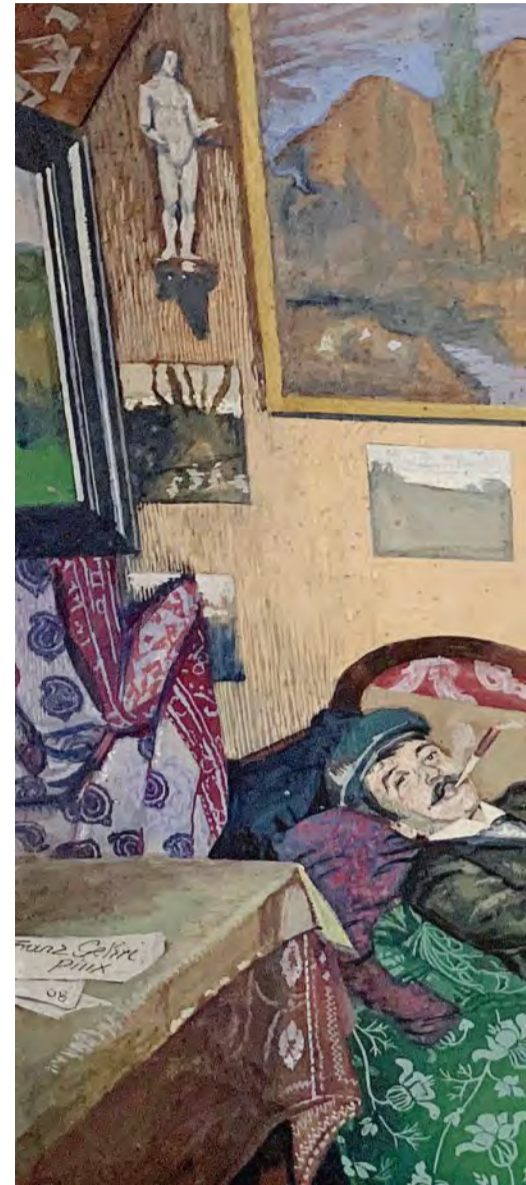
«Selbstportrait», Franz Gehri, 1908.