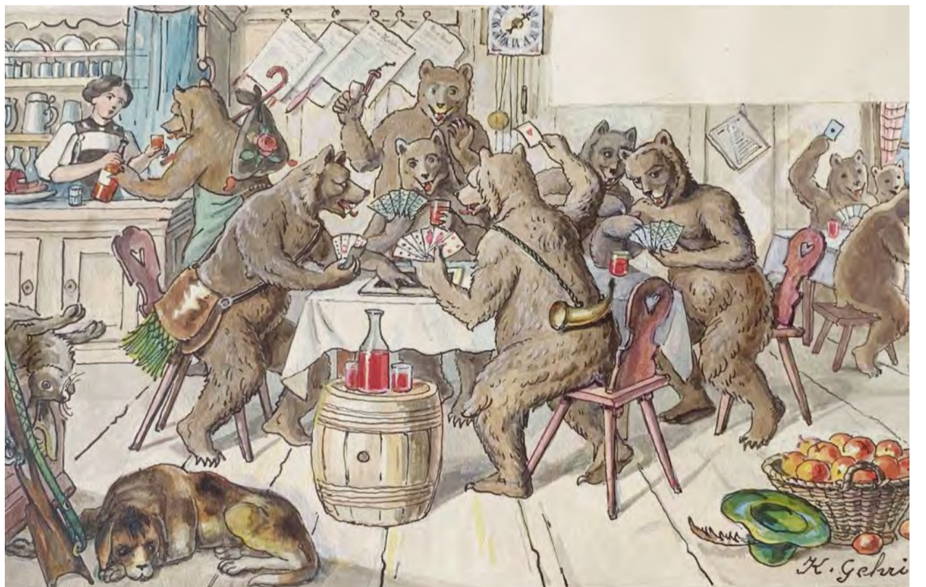
Bärenkarte (Entwurf), Karl Gehri, um 1910.

Manch einen Charakterkopf, dem er auf diesen Touren begegnet, skizziert er kurz und bannt ihn dann zuhause im Atelier auf ein Gemälde.